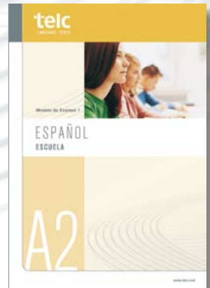
telc Español A2 Escuela Modelltest erhältlich Prüfungen ab 01.01.2008