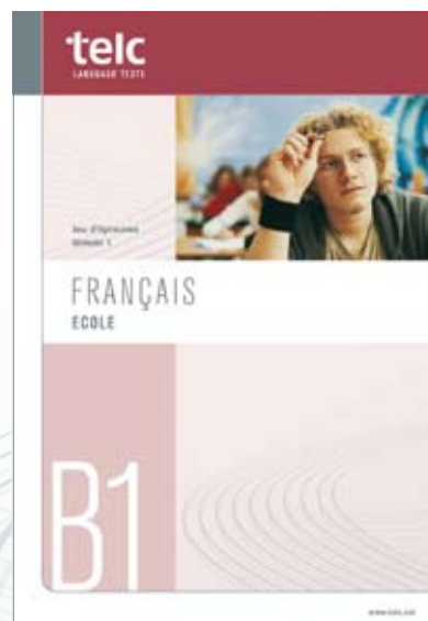
telc Français B1 Ecole Modelltest erhältlich Prüfungen ab 01.01.2008