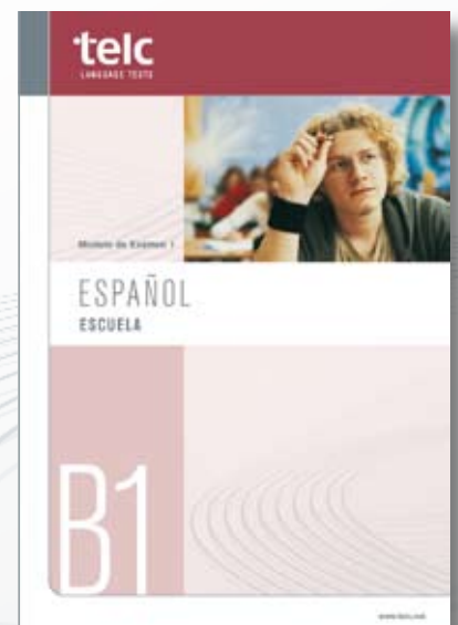
telc Español B1 Escuela Modelltest ab 01.03.2008 Prüfungen ab 01.06.2008