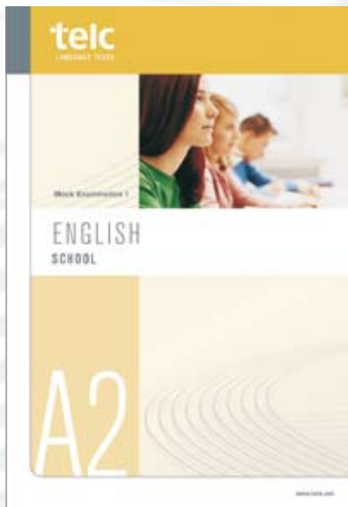
telc English A2 School Modelltest erhältlich Prüfungen ab 01.01.2008