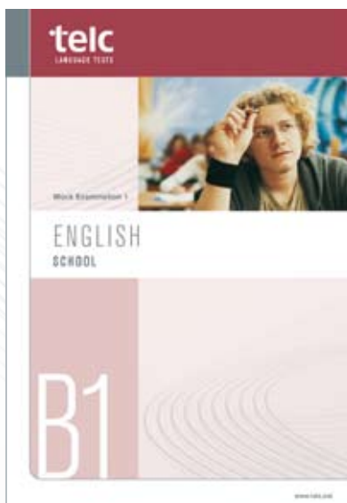
telc English B1 School Modelltest erhältlich Prüfungen erhältlich